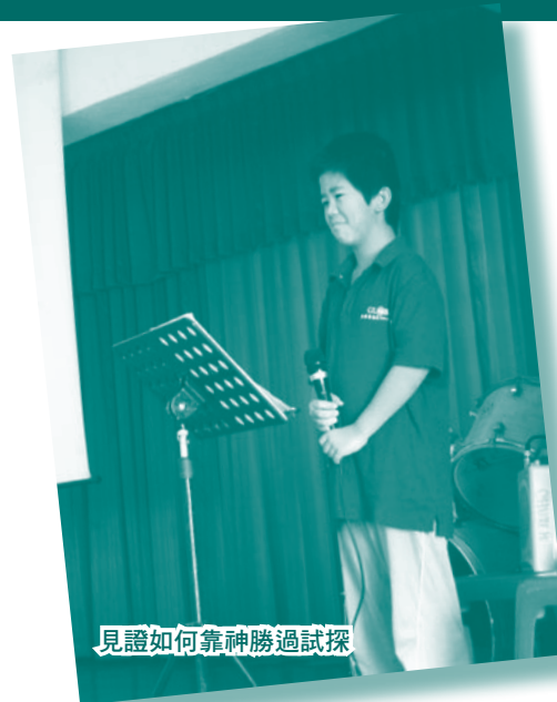
見證如何靠神勝過試探